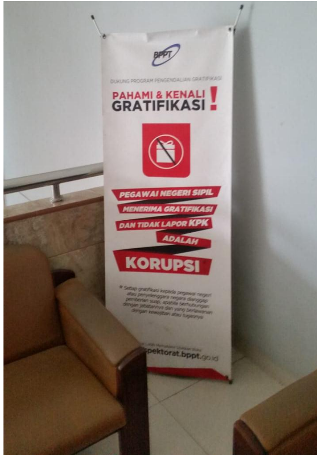
Gambar 3. Banner Penjelasan Gratifikasi