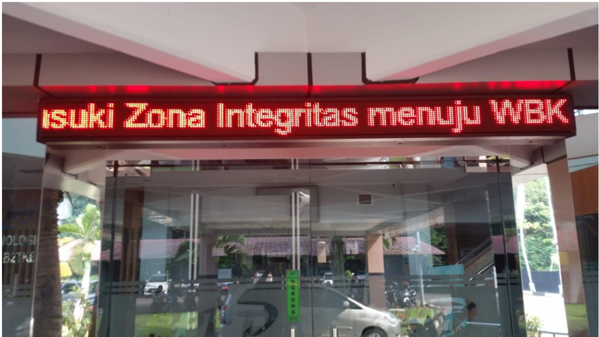
Gambar 5. Running Text ZI di Pintu masuk lobi B2TKE