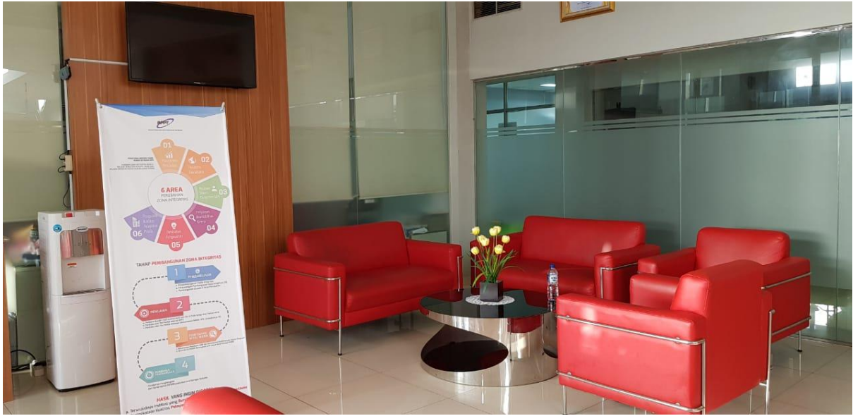
Gambar 4. Banner Pembangunan Zona Integritas