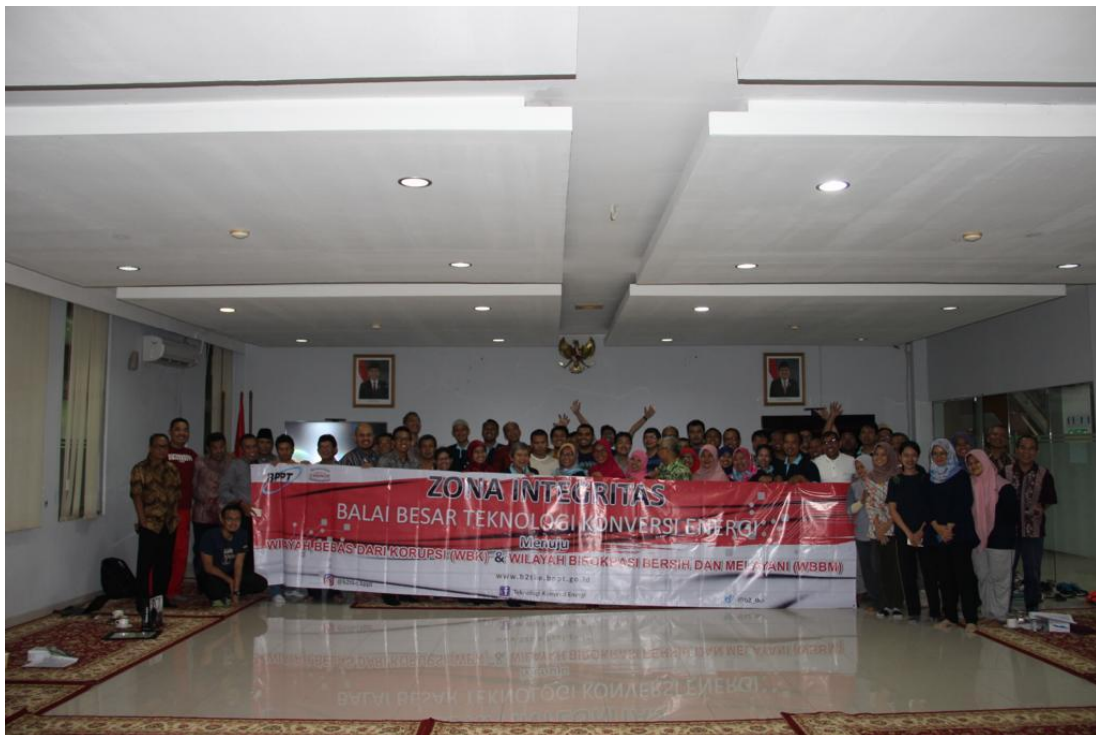
Gambar 1 Sosialisasi WBK dan WBBM

Dalam rangka mendukung program Reformasi Birokrasi BPPT, pada tanggal 01 Maret 2019 telah dilakukan sosialisasi pembangunan Zona Integritas menuju Wilayah Bebas dari Korupsi (WBK) dan Wilayah Birokrasi Bersih dan Melayani (WBBM) di B2TKE yang dihadiri oleh seluruh pegawai B2TKE. Sosialisasi dengan narasumber Inspektur BPPT ini bertujuan untuk memberikan pengetahuan dan dasar-dasar tentang zona integritas serta apa saja indikator-indikator yang harus tercapai untuk mencapai hal tersebut. Pada tahun 2019, B2TKE diajukan sebagai salah satu satker WBK dan WBBM melalui rapat pimpinan BPPT. Dalam akhir acara, Ka. B2TKE mencanangkan kepada seluruh pegawai B2TKE Bersama-sama mendukung program zona Integritas menuju WBK dan WBBM.