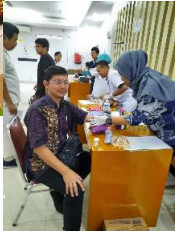
Pemeriksaan kesehatan seluruh staf