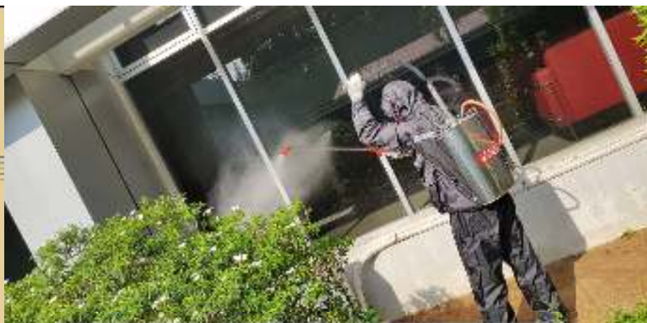
Penyemprotan disinfektan mandiri